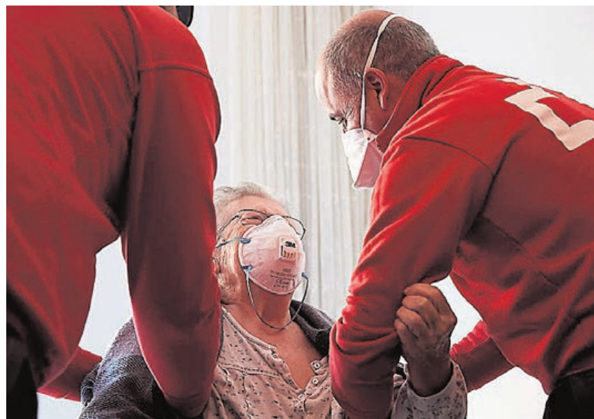
El Plan Responde busca ayudar a los más afectados por la pandemia.