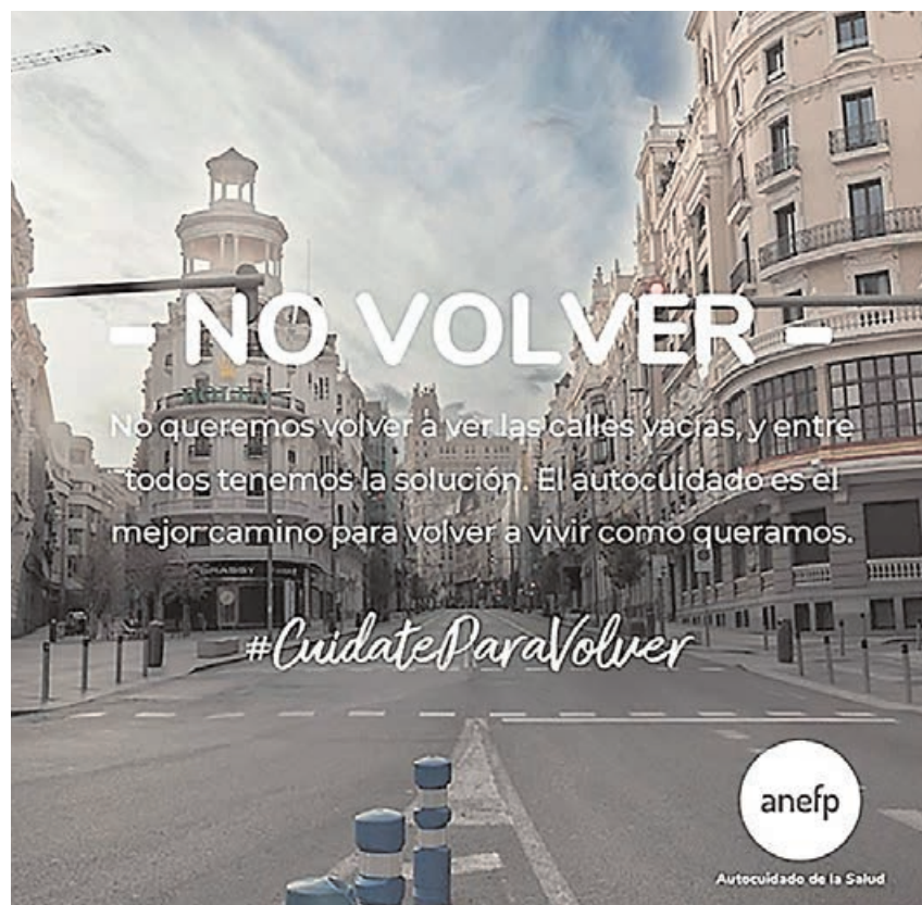
Una de las imágenes que se puede ver en el vídeo lanzado por Anefp.

De este modo, y bajo el lema ‘Sé responsable. Cuídate’, la campaña de Anefp pone el foco en las principales redes sociales, con el objetivo de llegar a todos los jóvenes españoles de una forma didáctica, ágil y sencilla. En palabras del director general de la asociación: “Muchos de ellos